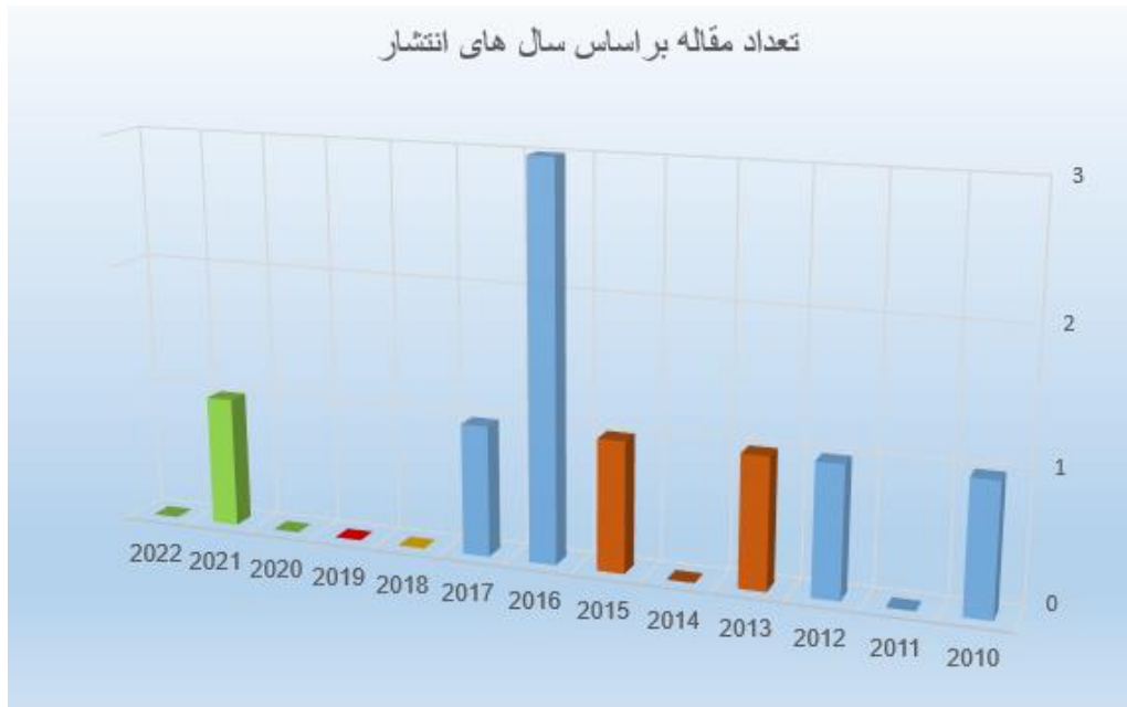
شکل ۲. روند انتشار مقالات.

در مرحله بعد، یک دیدگاه طولی در رابطه با تکامل مضامین مقالات شامل نمونه ارائه شده است (شکل ۲ را ببینید).