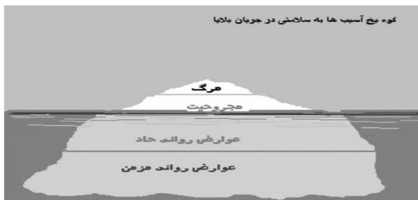
آسیب های آشکار و نهان بر سلامتی انسانها در جریان حوادث