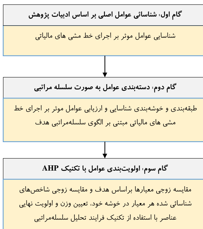
شکل ۱. فرایند اجرای تحقیق

مطالعه حاضر با هدف شناسایی و رتبه بندی عوامل مؤثر بر اجرای خط مشی های مالیاتی در ایران انجام شده است. این مطالعه از لحاظ هدف، کاربردی و از لحاظ ماهیت و شکل اجراء، توصیفی-پیمایشی است. الگوریتم اجرایی تحقیق در شکل ۱ نشان داده شده است.