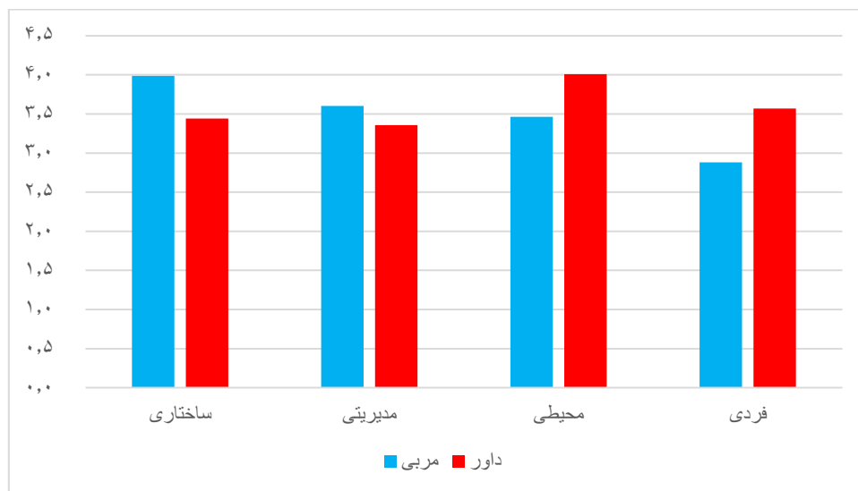
نمودار شماره ۲. عوامل ساختاری، مدیریتی، محیطی و فردی از دیدگاه مربیان و داوران فوتبال استان گیلان

√ بین دیدگاه مربیان فوتبال استان گیلان با بازیکنان حرفه ای فوتبال استان گیلان درباره عوامل موثر بر بروز پرخاشگری تماشاگران تفاوت معنی داری وجود دارد: با توجه به سطح معناداری آزمون که از ۰/۰۵ بیشتر می باشد، فرض برابری واریانس دو گروه را می پذیریم. در خصوص تفاوت میانگین دیدگاه مربیان فوتبال استان گیلان با بازیکنان حرفه ای فوتبال استان گیلان درباره عوامل موثر بر بروز پرخاشگری تماشاگران می توان گفت که با توجه به نتیجه آزمون T=2/999 ( , Sig=0/05) گویای این مطلب است که میانگین های دو گروه مربیان و بازیکنان حرفه ای فوتبال استان گیلان تفاوت معنی داری با یکدیگر داشته و این دو گروه از افراد با سطح اطمینان ۹۵ درصد در میانگین پرخاشگری با هم متفاوت هستند، به عبارت دیگر فرض H_1 مبنی بر اینکه بین دیدگاه مربیان فوتبال استان گیلان با بازیکنان حرفه ای فوتبال استان گیلان درباره عوامل موثر بر بروز پرخاشگری تماشاگران تفاوت معنی داری وجود دارد تایید می شود.